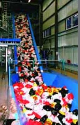
Søppelposene tømmes rett på transportbåndet...