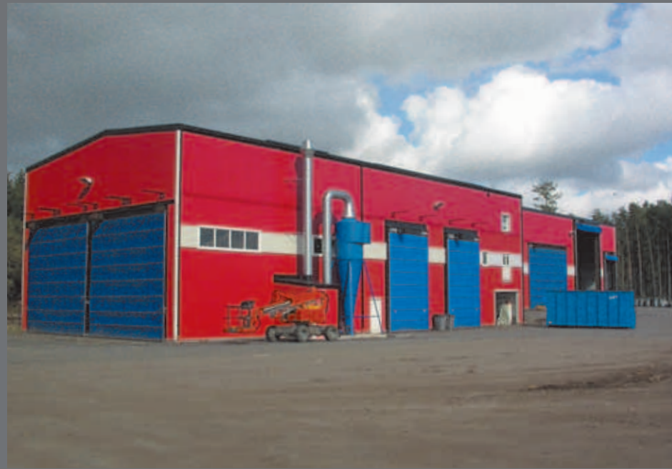
Flishults sorteringsanlegg i Vetlanda.

ReklamBogaget, Vetlanda, Sverige 2006-12