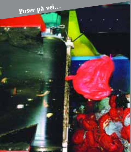
Poser på vei...