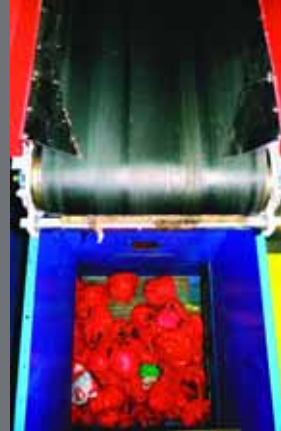
Poser sortert i beholdere.