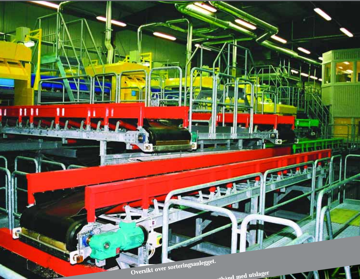
Oversikt over sorteringsanlegget.