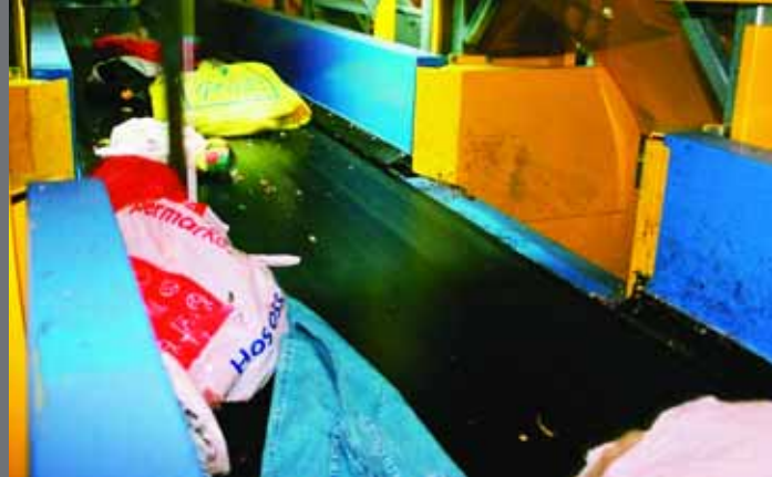
...for deretter å bli sortert etter posens farge.